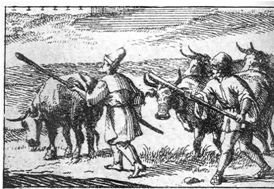
Țărani din Transilvania cu vitele la păscut (sec. XVII)

Pe o hartă criminogenă a principatului cele mai cunoscute „drumuri ale hoților” erau în părțile de nord, nord-est și est. În sud era ceva mai dificil pentru latroni deoarece aici se aflau pământurile sașilor și, în parte, a secuilor extrem de riguroși în măsuri antinfracționale, deși tratatele dintre domnitorii munteni și principii ardeleni vorbesc despre extrădarea răufăcătorilor care circulau de o parte și de alta a Carpaților Meridionali. Și despre tâlharii din teritoriile ocupate de turci în vestul principatului avem informații, aceștia preferând, ca locuri de refugiu, zonele muntoase ale Apusenilor sau ale Banatului, ce ofereau întotdeauna scut damnaților societății, indiferent de regimul politic.