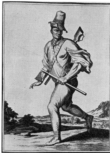
Tâlhar din Carpații de nord

o mare importanță sub aspectul menținerii ordinii și liniștii publice, situație în care intervenția la fața locului, prinderea în flagrant delict sau realizarea contactului direct cetățean-polițist sunt oportunități menite a îndeplini politicile de prevenție asumate de stat. În fine, atribuții de gospodărire a comitatului impuse slujbașilor poterei dovedesc faptul că în secolul XVII însă nu s-a realizat pe deplin separarea instituțiilor judiciare de cele administrative, cel puțin la nivel local. Fiind slujbași ai comitatului, membrii poterei nu puteau rămâne pasivi la eventualele disfuncționalități constatate (poduri distruse, terenuri necultivate sau încălcări ale ordinii social-religioase), fiind obligați, iată, să dispună măsuri în consecință.