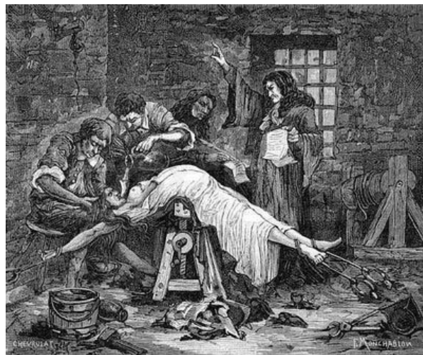
15. Proba apei aplicat unei femei suspecte de vrăjitorie

Intenționând a da tezei un caracter practico-aplicativ, am descris procedura de judecată plecând de la un exemplu concret, exemplu ce ne-a oferit posibilitatea cercetării unor instituții de drept care existau atunci și există și azi: sesizarea , părțile în procesul penal , avocatul , martorul sau jurătorii . O tâlhărie urmată de moartea victimelor consumată la finele secolului XVI în perimetrul satului Cluj-Mănăștur, consemnată destul de amănunțit de iezuitul Ștefan Szánto, ne-a creat condițiile analizării fazelor procesului penal: urmărirea penală , judecata și punerea în executare a sentinței emise de instanță . Tot acum am vorbit despre probă și despre rolul acesteia în stabilirea vinovăției sau nevinovăției suspectului și felul în care aceasta era gestionată în proces.