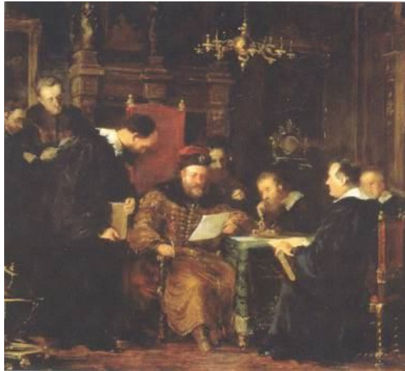
Principele Gabriel Bethlen printre oamenii de știință

Încă de la începuturile formării statului voievodal, faptele penale existau în dreptul cutumiar, fiind cuprinse mai târziu în decretele regilor unguri. Infrațiunile sunt studiate și grupate în Tripartitum și fac tot mai des obiectul hotărârilor dietale din secolul XVI. În schimb, cele două corpuri de legi ale veacului XVII, Approbatæ și Compilatæ reprezintă apogeul efortului de codificare legislativă din istoria medie a Transilvaniei, penalul și procedura penală beneficiind, în sfârșit, de o tratare relativ distinctă. Studiul culegerilor de legi și a actelor emise de diete au conturat preocuparea autorităților de a ține în frâu infraționalitatea, de a face ordine în stat prin crearea unor instituții dotate cu mecanisme juridice moderne și eficiente, adaptate la specificul regnicolar.